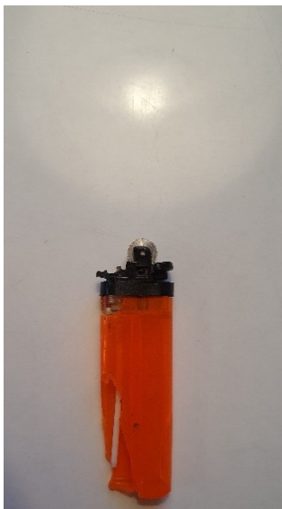
Selemat Ja /Vær i glæden.