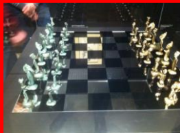
A New Tomorrow

healing clairvoyance kanalisering astrologi meditation Blueprintet er i spil !